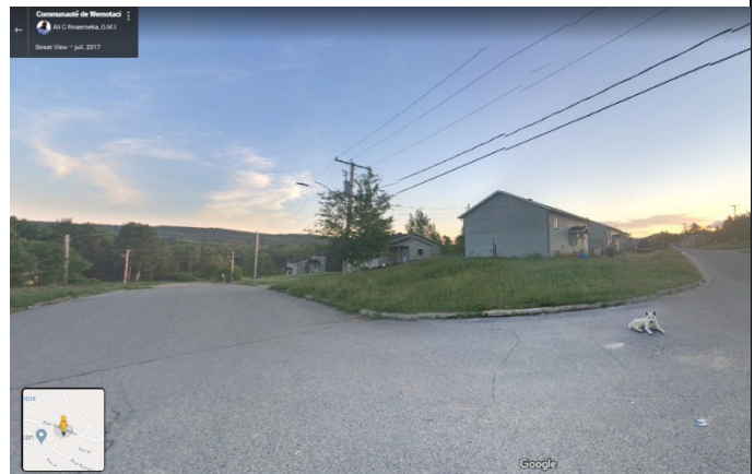
Territoire autochtone – Communauté de Wemotaci ( https://goo.gl/maps/78wd3KxnJVdeq5Cx7 )