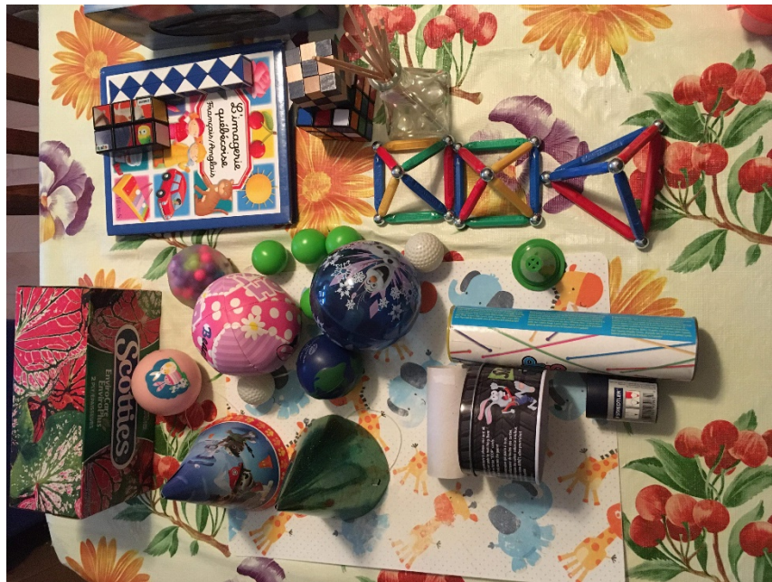
Exemples d'objets récupérés par des enfants de 1 re année

Exemples d'objets : bibelot d'une pyramide maya, module de parc