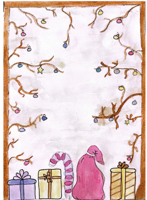
Œuvre de Maïka Audet-Desrosiers, élève de 5 e secondaire, réalisée à partir de pigments et colorants naturels issus de fruits, légumes, épices ou herbes dans le cadre d'un projet interdisciplinaire réunissant le cours d'option en science (Science au quotidien) et le cours d'arts plastiques, école secondaire Le Tremplin, 2025.