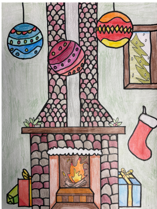
Œuvre réalisée par Alicia Lavoie, 6 e année, école intégrée d'Or-et-de-Champs, Édifice Notre-Dame-de-l'Assomption, 2025