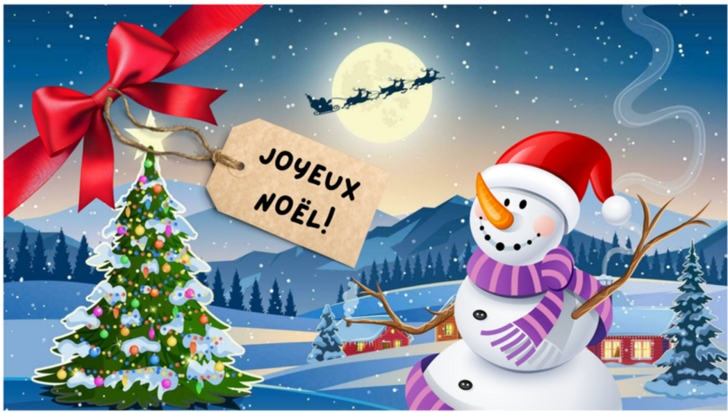
Œuvre réalisée par Liam Morin, 5 e secondaire, dans le cadre du cours Multimédia, Polyvalente Le Carrefour, 2025